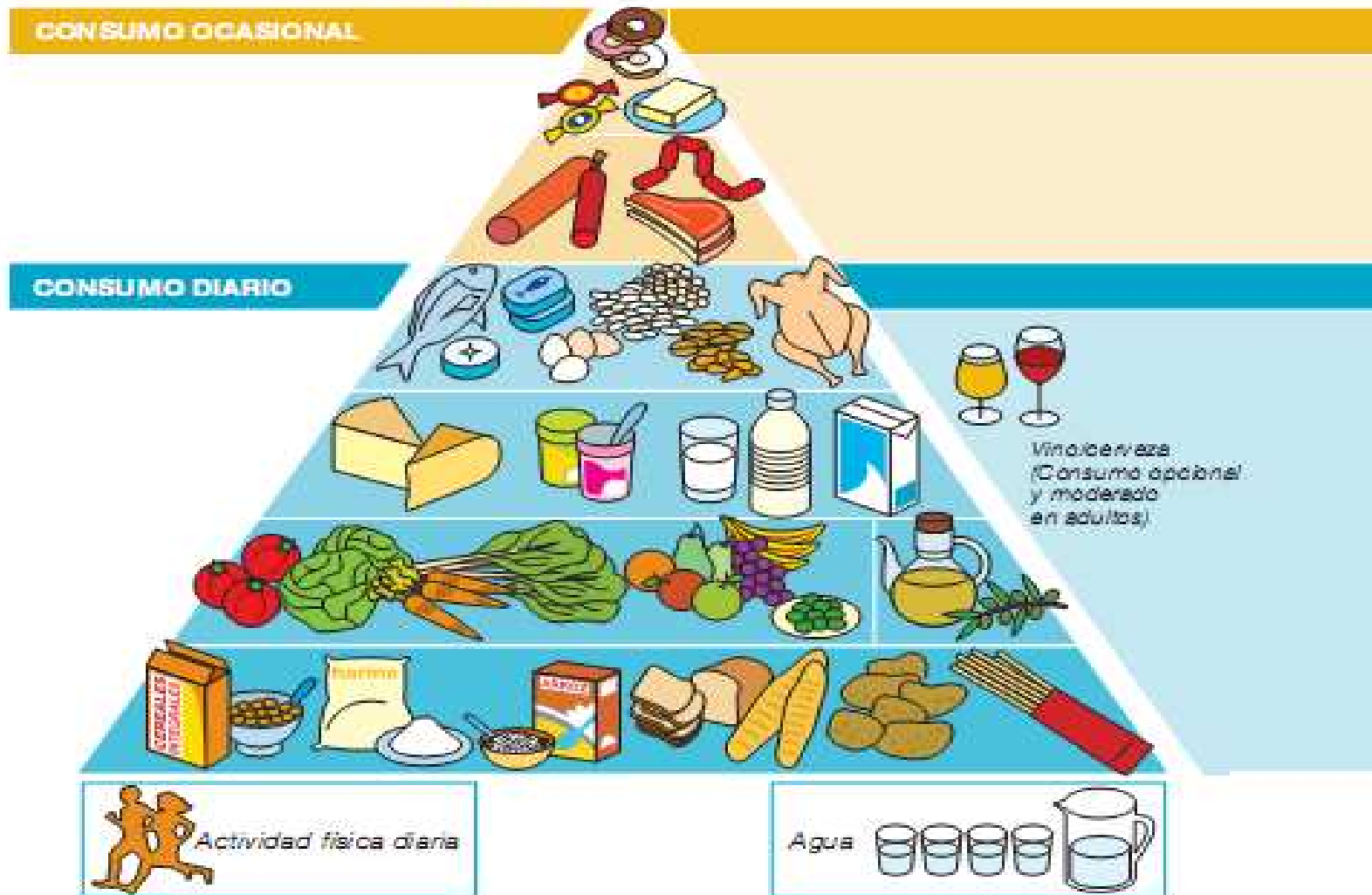
Pirámide de la Alimentación Saludable (SENC, 2004)